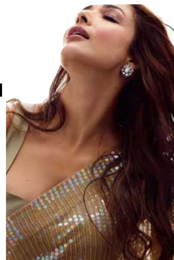
मलाइका अरोड़ा ने ब्राउन कलर की चमकीली साड़ी पहन दिए जबरदस्त पोज