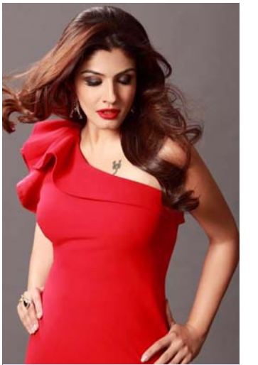
रवीना टॉन KGF 2 की शूटिंग के लिए पहुंची इलाहोड़ी