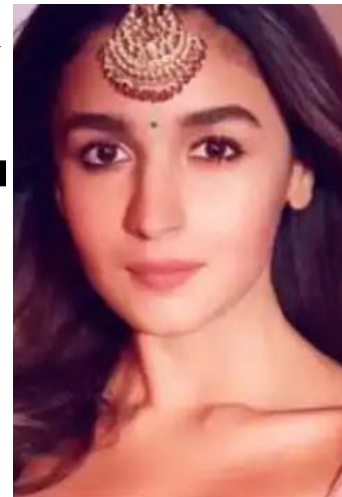
दो महीने बाद आलिया भट्ट ने खोला कॉमेेंट रोडशन