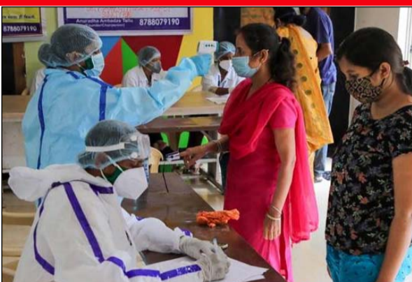
से नीचे रह गई है। उन्होंने बताया कि देश में एक से सात जुलाई तक औसतन प्रतिदिन 2,30,751 कोरोना जांच की गई थी और 22 से 28 जुलाई तक यह संख्या बढ़कर 4,21,940 नमूने प्रतिदिन और